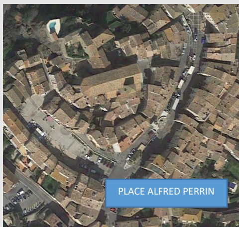
PLACE ALFRED PERRIN