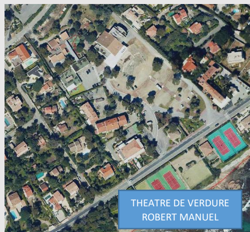
THEATRE DE VERDURE ROBERT MANUEL