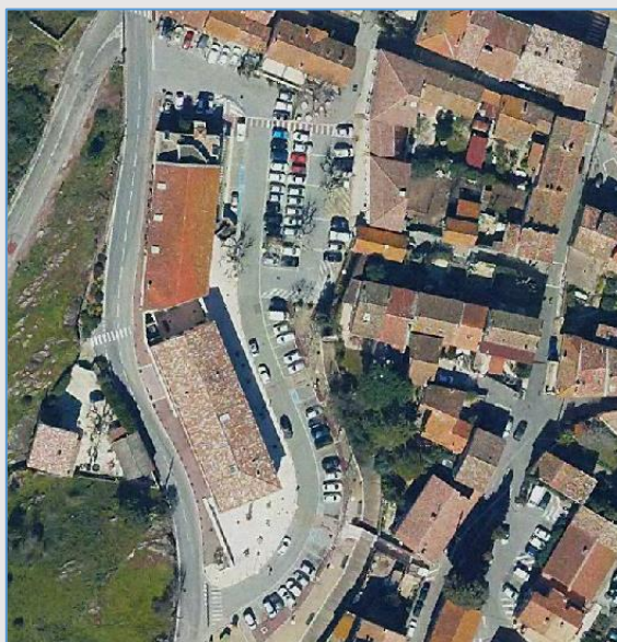
Place Germain Ollier / parking du jardin des Artichauts

Mise à disposition du domaine public communal pour l'organisation de vide-greniers sis Place Germain Ollier/Parking du jardin des Artichauts – quartier du Village le lundi 21 avril 2025 de 5 heures à 20 heures et lundi 9 juin 2025 de 5 heures à 20 heures, et Complexe Calandri – quartier de la Bouverie le dimanche 26 octobre 2025 de 5 heures à 20 heures.